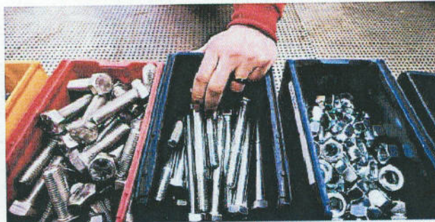
Det är inga vanliga skruvar och muttrar som Almén Special Fastner levererar, utan rejäla doningar.

Och han fick en raketstart. Genom att importera fästelement, det vill säga speciellskruvar och muttrar, från Tyskland, Italien och Skottland, kan han leverera kvalitetsmaterial till sina